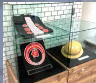
関電トンネル建設時に使用していたはつぴとヘルメット（複製品） / ㈱熊谷組