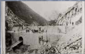
布引五本松ダム 創設工事 / 神戸市水道局