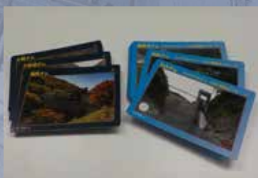
ダムカード

◆講演会 場所：大阪府立狭山池博物館 2階ホール 無料 定員126名（当日先着順） 受付：午後1時30分から