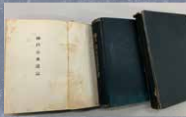
神戸市水道誌（明治43年）/ 神戸市水道局

近代に神戸港に立ち寄った外国の船乗りの中で「赤道を越えても水が腐らず、良質でおいしい水」として世界に名を馳せた“KOBE WATER”を象徴する水道施設、布引五本松ダム（正式には「布引五本松堰堤」で、日本で最初のコンクリートダム）、立ヶ畑ダム、千苺ダムを建設過程の写真、図面等で紹介します。（神戸市水道局所蔵）