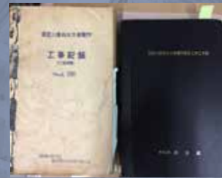
黒部川第四発電所工事記録・工事誌（朱色で昭和33年2月25日午後7時40分貫通確認と記入）（昭和36年）