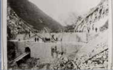
布引五本松ダム 創設工事