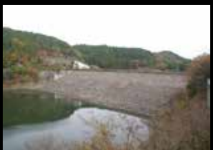
箕面川ダム（大阪府箕面市）