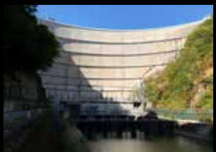
矢木沢ダム（群馬県みなかみ町）