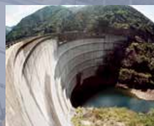
坂本ダム（奈良県）/ J-POWER [電源開発株]