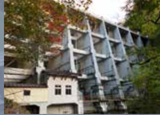
バットレスダム 丸沼ダム（群馬県片品村）

黒部ダムの関電トンネル貫通60周年記念として、黒部ダムコーナーを設け、建設当時の測量器具、計算機や図面、記録写真等を展示します。関電トンネル貫通確認図面は初出品です。また、関西電力のダム20基（殿山ダム、多々良木ダム等）も写真と文字パネルで紹介しします。