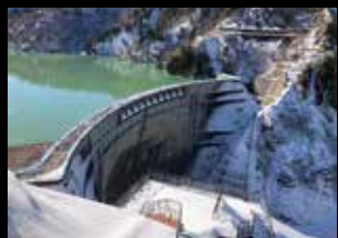
黒部ダム（富山県立山町）