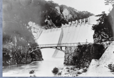
千苺ダム かさ上げ工事中