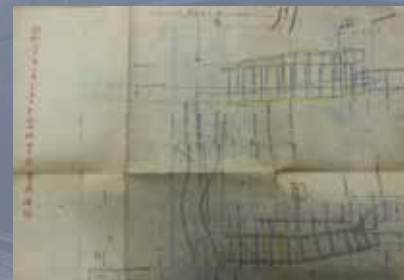
関電トンネル貫通確認図面 / ㈱熊谷組