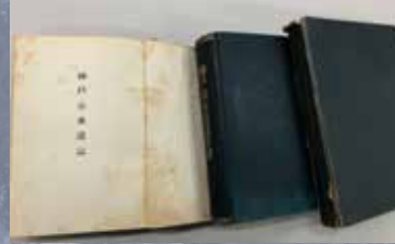
神戸市水道誌（明治43年）/ 神戸市水道局

近代に神戸港に立ち寄った外国の船乗りの中で「赤道を越えても水が腐らず、良質でおいしい水」として世界に名を馳せた“KOBE WATER”を象徴する水道施設、布引五本松ダム（正式には「布引五本松堰堤」で、日本で最初のコンクリートダム）、立ヶ畑ダム、千苺ダムを建設過程の写真、図面等で紹介します。（神戸市水道局所蔵）