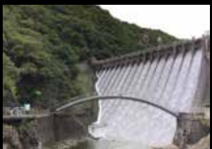
千刃ダム（兵庫県神戸市）