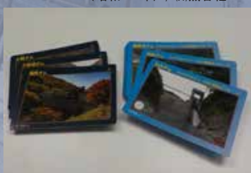
ダムカード / 東京電力ホールディングス株

◆講演会 場所：大阪府立狭山池博物館 2階ホール 無料 定員126名（当日先着順） 受付：午後1時30分から