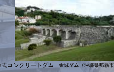
重力式コンクリートダム 金城ダム（沖縄県那覇市）