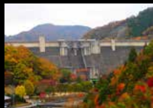
一庫ダム（兵庫県川西市）