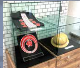
関電トンネル建設時に使用していたはつぴとヘルメット（複製品）/ ㈱熊谷組