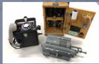
黒部ダム建設当時の測量器具、計算機 携帯電話 / 関西電力株