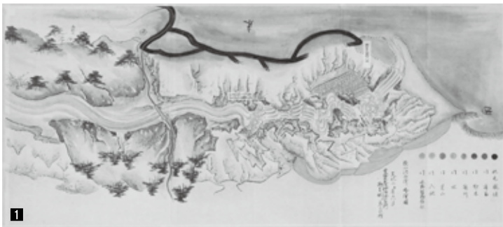
1 狭山池西除ヶ略絵図／文化2年(1805)